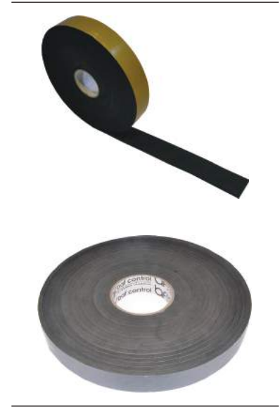
BAF EPDM STRİP

BAF EPDM-STRIP ürünleri, 10mm - 1000mm aralığında talep edilengenişlikte üretilir ve her yüzeyde kullanımı oldukça kolaydır. Galvaniz, kutu profil konstrüksiyonlarının, gaz beton, tuğla duvarların ve yüzer şapların duvar/döşemelerle temasını engellemek için farklı kalınlık ve genişliklerde kullanılabilir.