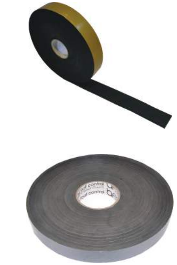
BAF EPDM STRIP